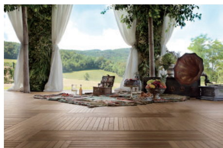
Listone Giordano Quadrone

以前は、見積書を PDF にして物件に添付していたので、商品ごとの粗利や受注に至る金額などの分析などはできませんでしたが、今では、重複入力することなく、製品ごとの強み、弱みなどの分析が簡単にできるようになりました。