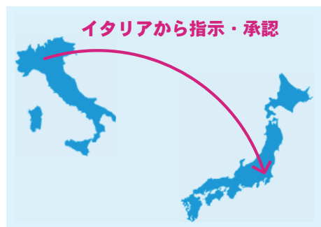
イタリアから指示・承認

日本での物件の動きをみてヨーロッパのメーカーと交渉でき、翌日、日本で仕事を始めるときには、物件の対応状況が調整できている状況で、24時間が有効に動いています。